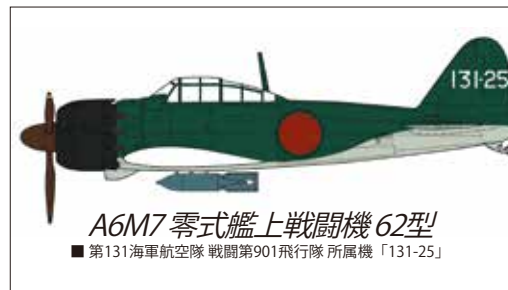
A6M7 零式艦上戦闘機 62型 ■ 第131海軍航空隊 戦闘第901飛行隊 所属機「131-25」