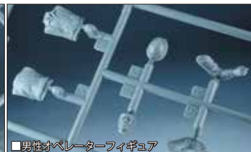
■男性オペレーターフィギュア