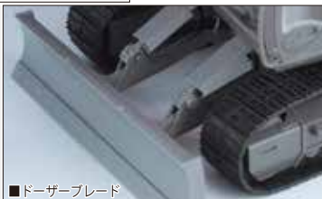
■ドーザーブレード