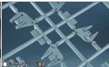
■ドーザーブレード基部