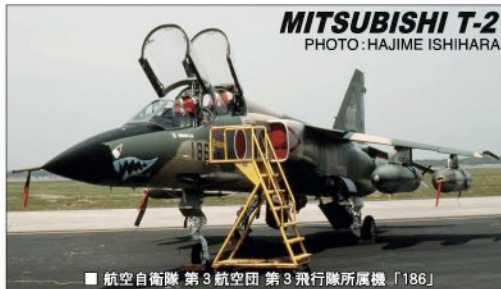
MITSUBISHI T-2