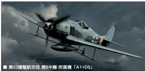
■ 第53爆撃航空団 第8中隊 所属機「A1+DS」